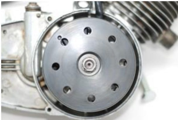
Motor der ILO

Verändert diese sich, wiederholen Sie den Vorgang bitte.