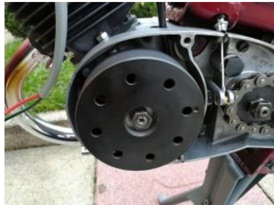
Motor der DKW Hummel

- Setzen Sie den den Deckel zurück auf den Motor.