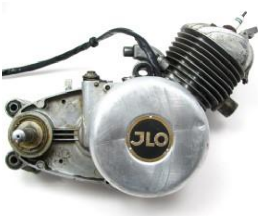
Motor der ILO