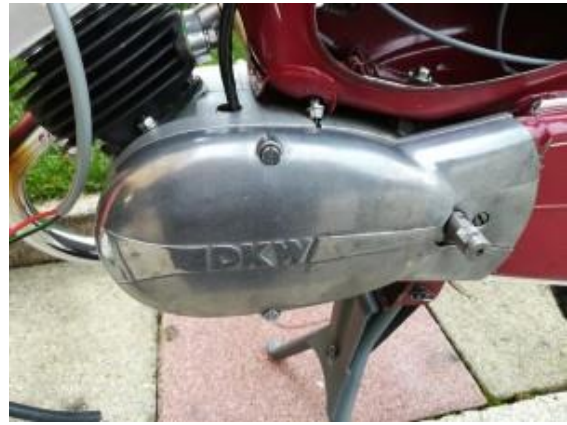
Motor der DKW Hummel